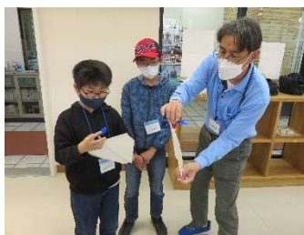
福山少年少女発明クラブ