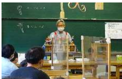
広島少年少女発明クラブ

2021 年度第 19 期からのクラブ員 6 名、新規参加者 12 名、合計 18 名が 6 班に分かれて「スカイスクリュー」を製作しました。参加者は主軸となる竹ひごにプロペラを固定し、横木を通し、羽となる紙にオリジナルの図や絵を描くなど、工夫を凝らしながら熱心に取り組みました。